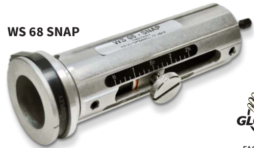
WS 68 SNAP